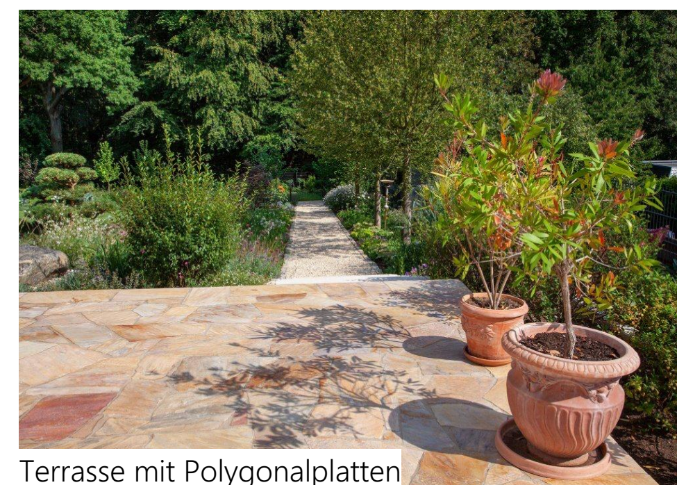
Terrasse mit Polygonalplatten