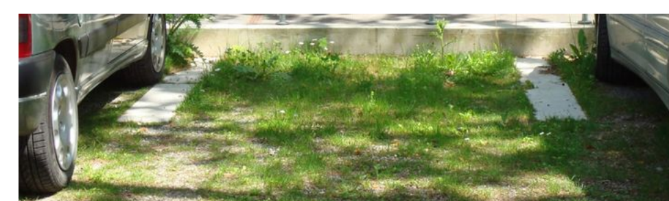
Schotterrasen (bei Feuerwehzufahrt)